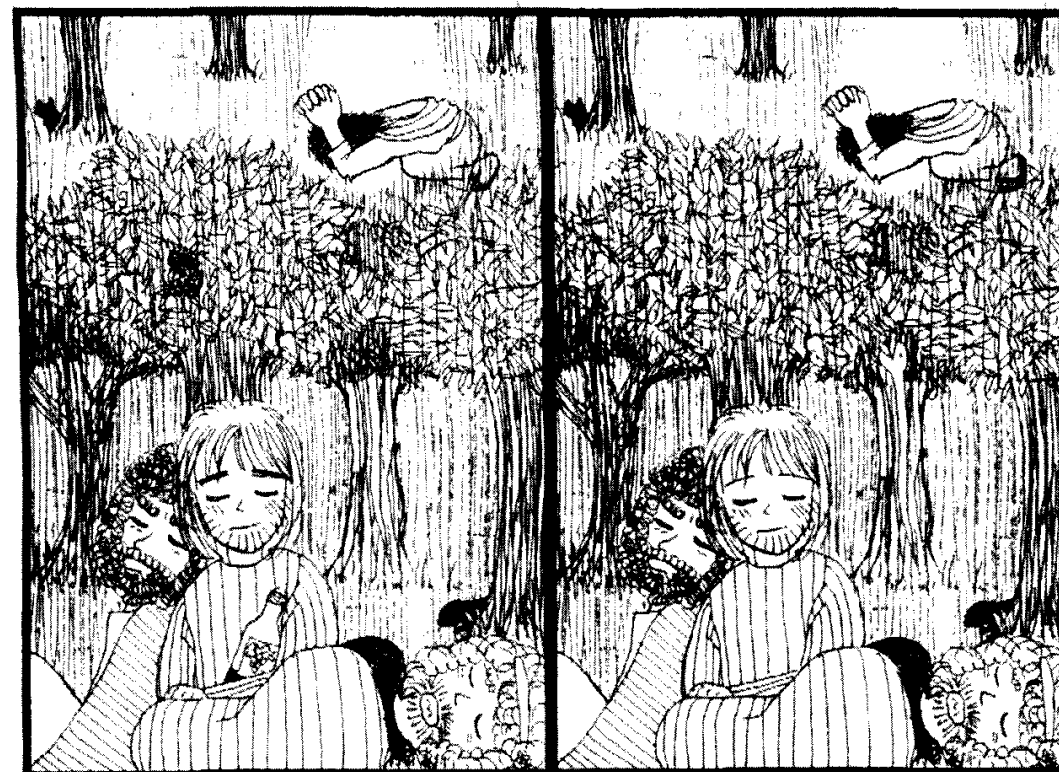
★弟子がひらきながら祈る。この絵には右のほうにカ所手がないがある。ながしてね。

「わが○○よ、もしできることでしたら どうか、この○○○○を わたしから○○○○せてください。 しかし、わたしの○○○○のままには なく、○○○○のままになさって 下さい」。(マタイ26:39)